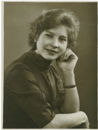
Юность. Ленинград, 1962 г.

кой. Чтобы купить себе новое постельное бельё, туфли, платье или спортивный костюм, в перерывах между дежурствами она помогала разгружать на железнодорожной станции вагоны с песком и стекловатой или грузовики с молочными продуктами у ближайшего к её работе магазина.